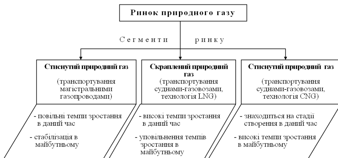
Рисунок 1 – Сегментування ринку природного газу за товарною та транспортною ознаками

енергоресурсів у багатьох країнах світу, відбуваються зміни у ресурсній базі внаслідок вичерпування запасів газу великих родовищ, змінюються напрямки газових потоків, знижуються рівні завантаження цілого ряду газопровідних систем, виникає необхідність реалізації масштабних інвестиційних проектів щодо будівництва нових газопроводів, зорієнтованих на нові регіони газовидобутку. На цьому фоні знову посилюється інтерес до технологій LNG, які характеризуються значно вищим рівнем гнучкості та оперативної мобільності, ніж трубопровідні технології, дозволяючи швидко переорієнтувати газові потоки та забезпечуючи значно ширші можливості країн-імпортерів для диверсифікації джерел постачання газу на національні ринки.