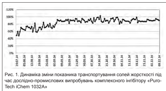
Рис. 1. Динаміка зміни показника транспортування солей жорсткості під час дослідно-промислових випробувань комплексного інгібітору «Puro-Tech iChem 1032A»

Із 14.10.2014 року концентрацію інгібітору зменшили до 25 \text{ г/м}^3 .