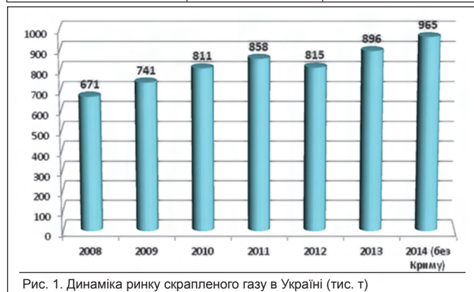
Рис. 1. Динаміка ринку скрапленого газу в Україні (тис. т)

додатковими митами у розмірі 5–10 %, бензини та інші енергоресурси [13]. Ще раніше пропонувалося запозичити діючу у Європі систему електронних акцизних товаротранспортних накладних [14].