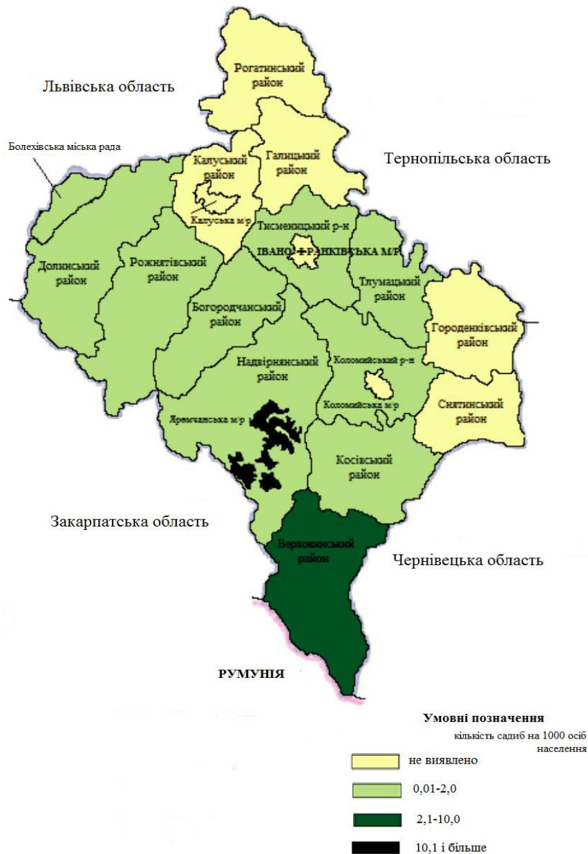
Рис. 2. Карто-схема розташування садиб сільського зеленого туризму в Івано-Франківській області

Також на чисельність садиб можна орієнтуватися, проаналізувавши кількість оголошень щодо надання послуг розміщення на таких відомих веб-ресурсах як Booking.com та Karpaty.ua (рис. 3).