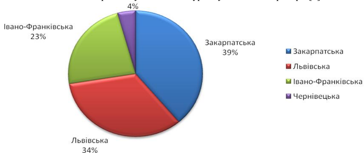
Рис. 3. Співвідношення кількості садиб сільського туризму по областях Карпатського регіону

Сільський туризм гармонійно вписується у концепцію багатофункціонального сталого екологічного розвитку села, досить часто є важливим чинником, що впливає на економічну, суспільну, культурну та екологічну ситуацію у регіоні. Прийняття рішення стосовно сприяння місцевому самоврядуванню вимагає здійснення оцінки туристичних об'єктів, інфраструктури села, рівня туристичної абсорбції території. Отже, важливим є визначення можливостей розвитку сільського туризму на певній території [6].