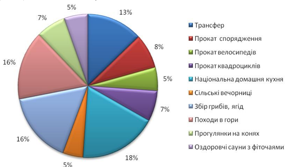
Рис. 4. Додаткові послуги садиб сільського зеленого туризму

Основні елементи, що впливають на створення власного іміджу, «родзинки» зеленої садиби є різновид послуг, що пропонує своїм відпочиваючим власник агрооселі. Найбільш поширеними (окрім проживання) послугами в садибах Івано-Франківської області є: трансфер, прокат спортивного та відпочинкового інвентарю (лиж, квадроциклів), прокат велосипедів, стіл та інвентар для настільного тенісу, сауна (баня), гойдалки (гамак) та національна кухня.