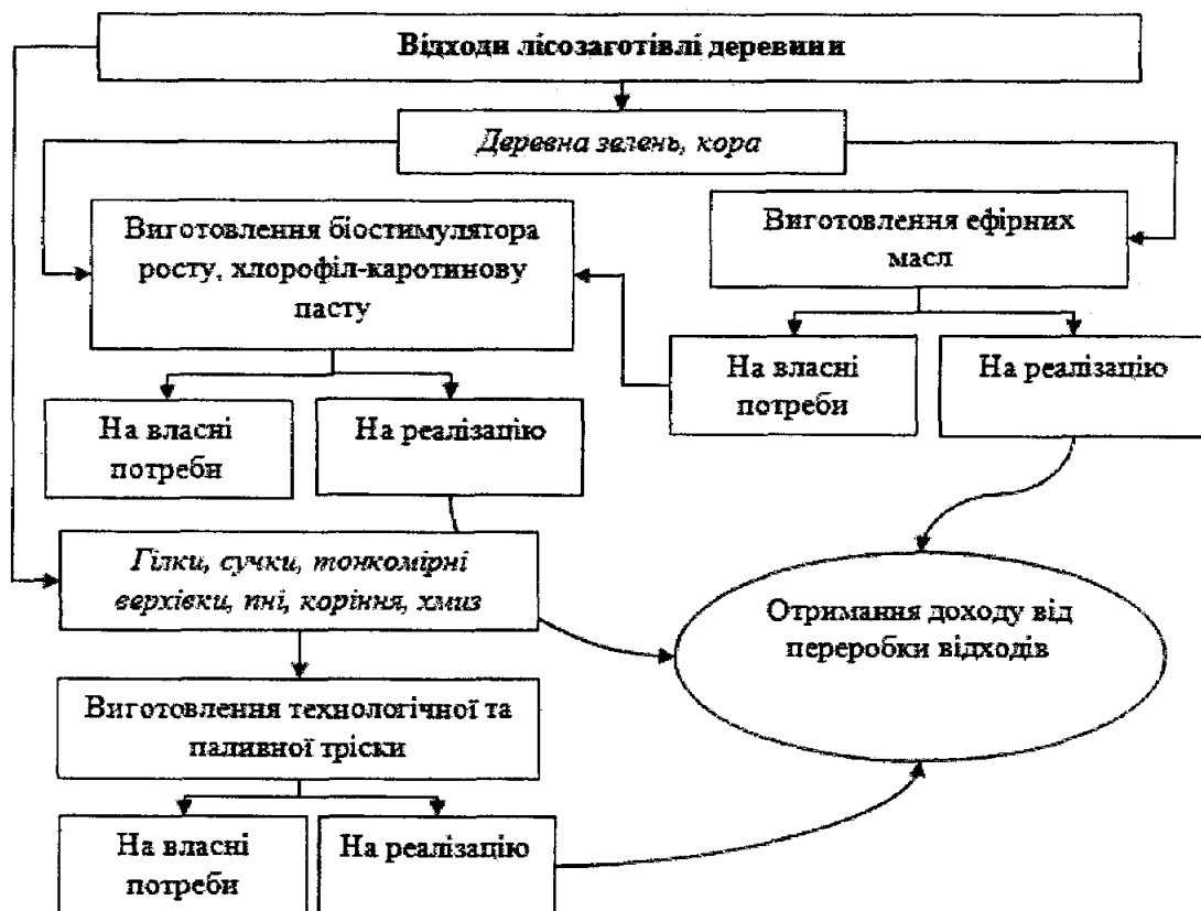
Рисунок 3 – Модель переробки відходів лісозаготівлі та первинної переробки деревини

Враховуючи всі необхідні зміни, організаційна модель лісового господарства виглядає наступним чином (див. рис. 4).