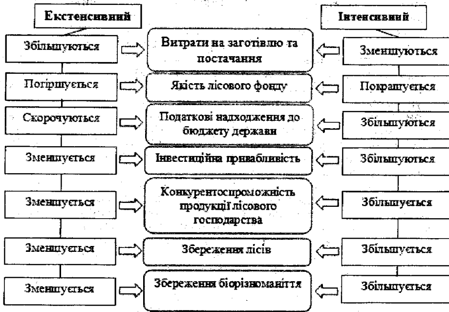
Рисунок 1 – Результати двох шляхів розвитку лісового господарства

Інтенсивне лісокористування найбільш розвинуте в Швеції і Фінляндії. Шведсько-фінська («скандинавська») модель інтенсивного лісокористування побудована, в першу чергу, на створенні правильної системи проведення рубок догляду: за лісом доглядають так, як за городом, забезпечуючи вихід певних лісоматеріалів. Антиподом інтенсивної моделі лісокористування можна вважати екстенсивну модель, яка домінує в Росії і в Канаді. Ця модель будується на абсолютно інших економічних і лісівничих підходах і має на увазі, перш за все, піонерні освоєння лісових територій, свого роду «збиральництво» деревини, а не її інтенсивне вирощування. У рамках екстенсивної моделі лісового господарства прибуток отримують лише один раз – в результаті фінальної рубки [5, с. 481].